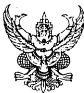
ขนาดตัวครุฑสูง ๓ เซนติเมตร